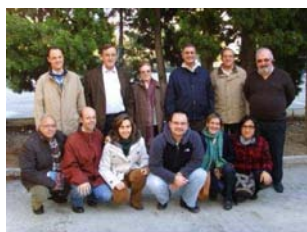
Miembros del Patronato y del Equipo Coordinador

La Fundación Acción Marianista para el Desarrollo es la ONG de la Familia Marianista de España dedicada a la Cooperación y Educación para el Desarrollo a través de 4 áreas fundamentales: