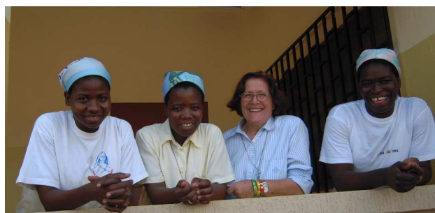
Comunidad marianista en Kapchilé

La ilusión de acompañar procesos de desarrollo y tener la oportunidad de ser testigos de la mejoría en la calidad de vida de las personas hace que todo el colegio siga sintiendo la alegría de apoyar las obras de quienes día a día conviven con una realidad que cala en lo profundo del ser humano.